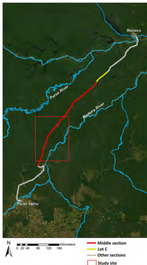
Figura 2. Mapa esquemático da BR-319 com os trechos administrativos da rodovia em estudo.