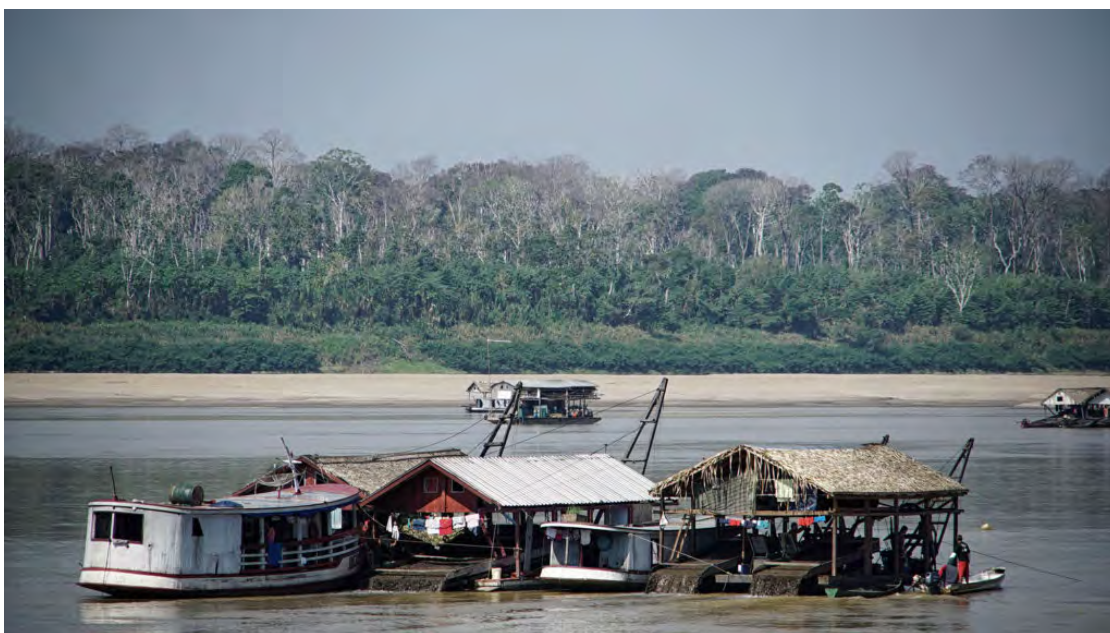
Balsa de garimpo no rio Madeira próximo a Humaitá