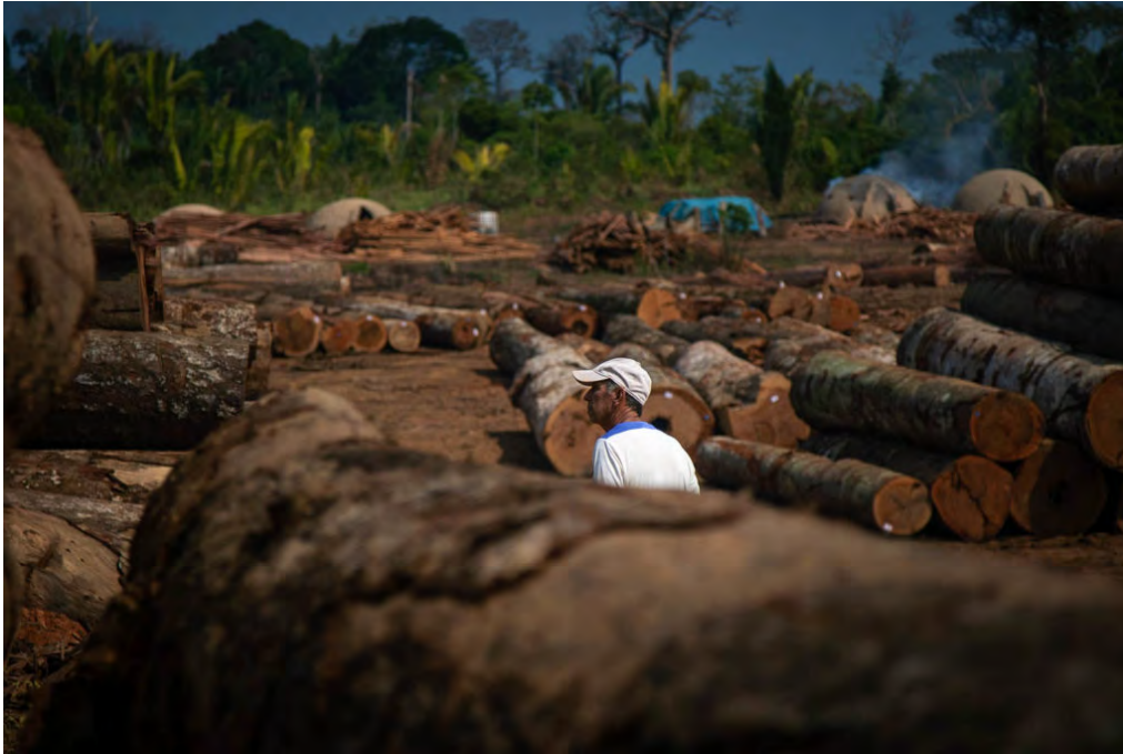
Pátio de madeira em Realidade, AM na BR-319

Fizemos observações na BR-319 em dois módulos de pesquisa do Programa de Pesquisa em Biodiversidade, do Instituto Nacional de Pesquisas da Amazônia (PPBio / INPA), em 10 pontos que estão sofrendo degradação florestal devido à exploração madeireira (Fig. 1 (a)). Observamos distúrbios nessas parcelas, como trilhas de arraste, árvores arrancadas, copas de árvores danificadas e clareiras, bem como pátios de armazenamento de toras, tocos de árvores cortadas na exploração de madeira e árvores marcadas para corte em um futuro próximo (Fig. 1 (b)). A exploração madeireira não atende aos procedimentos e parâmetros para projetos legais de manejo florestal [9].