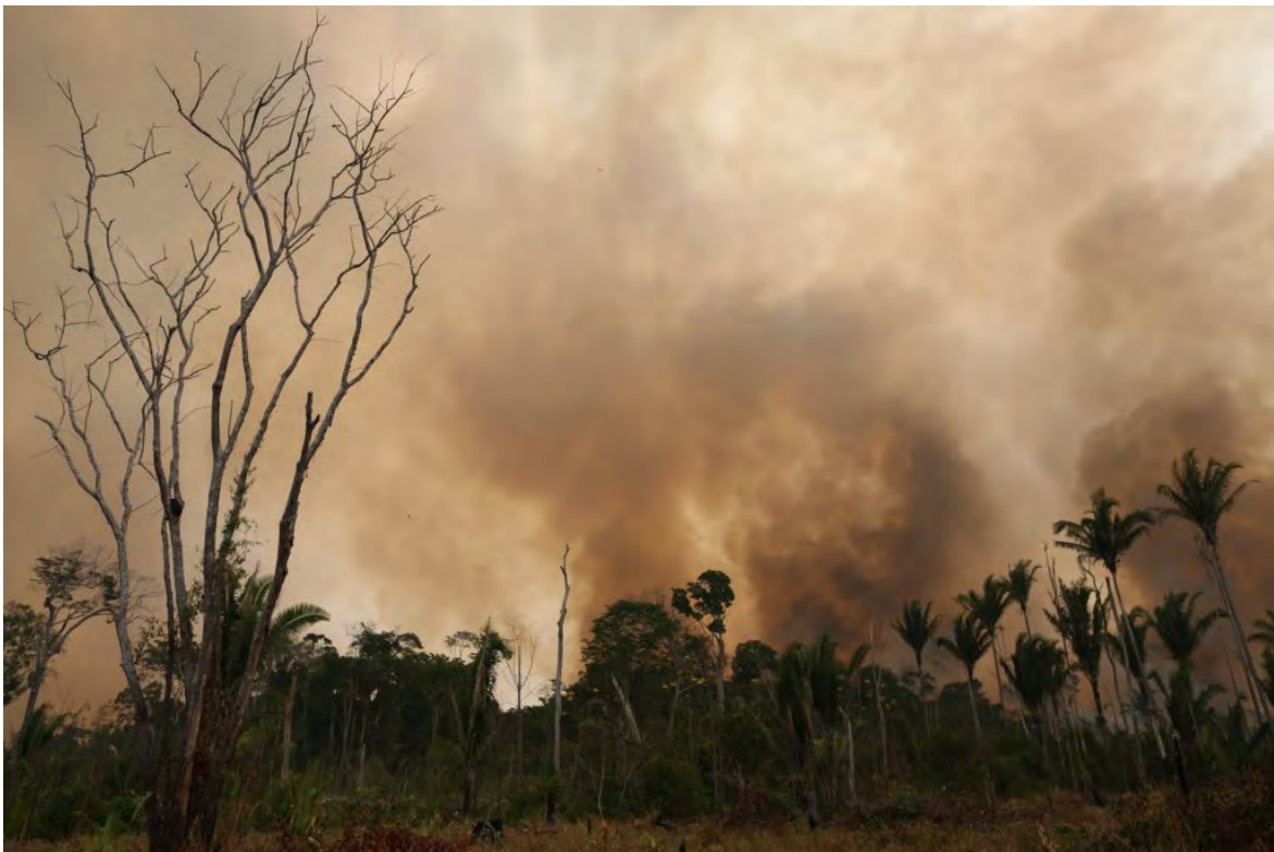
Queimada ocorrida no entorno da Estação Ecológica Cuniã, no norte de Rondônia, próxima a

BR 319