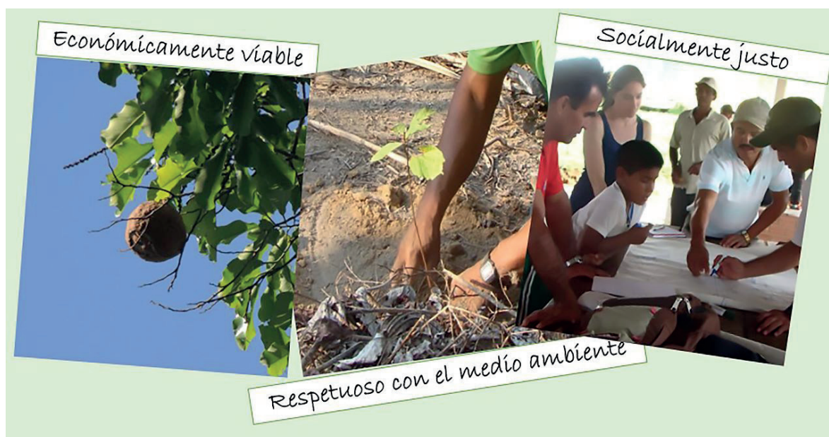
Figura 1. Fundamentos orientadores para la conservación del recurso natural del bosque.

Por lo tanto, toda actividad de aprovechamiento forestal debe garantizar y cumplir tres fundamentos orientados para la conservación de los recursos naturales del bosque siendo económicamente viable, respetuoso con el medio ambiente y socialmente justo conforme se observa a Figura 1 (Álvarez y Vargas-Hernández, 2012; Riaño Barrera, 2017; Romero et al. , 2021; Gramkow y Porcile, 2022).