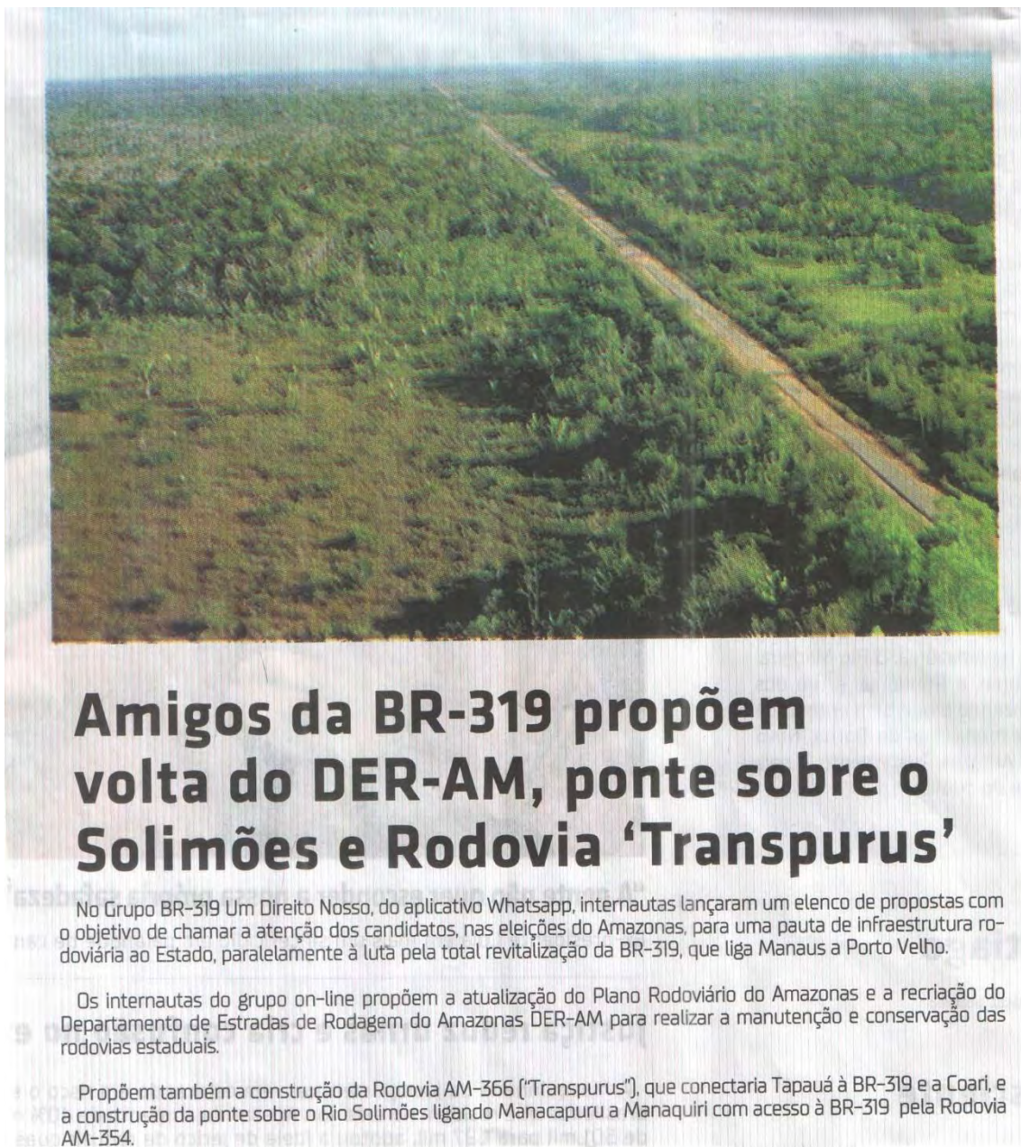
Figura 7. O grupo de lobby “Amigos da BR-319” está pressionando também pela AM-366. A AM-366 é planejada apenas por causa da BR-319, e essas duas rodovias e seus impactos não são separados [2].

As rodovias planejadas AM-366 e AM-343 aparecem no mapa do DNIT (Figura 8), mas são rodovias estaduais do Amazonas. Isso enfraquece o licenciamento ambiental, uma vez que o licenciamento pelas instituições estaduais é menos exigente e mais facilmente manipulados que o federal. Em 2017, isso ficou muito claro para o IPAAM, a instituição ambiental do Estado do Amazonas, quando garimpeiros ilegais de