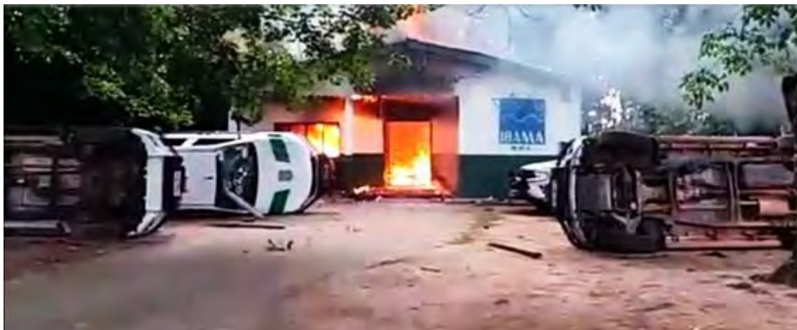
Figura 9. O licenciamento da garimpagem ilegal no rio Madeira pelo órgão ambiental do Amazonas, a pedido do governador, logo após os garimpeiros incendiarem as sedes de IBAMA e ICMBio em Humaitá, ilustra a falta de independência dos órgãos estaduais para resistir pressão política no licenciamento de obras como a rodovia AM-366 (Fonte: [6]). [7]

A imagem que abre este artigo mostra uma vista aérea do início do trecho da rodovia AM 366 ao lado do aeroporto de Tapauá, no Amazonas, norte do Brasil (Foto: Alberto César Araújo/Amazônia Real).