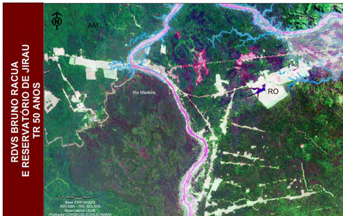
Figura 2. Reserva Departamental Bruno Racua, Bolívia e área de inundação do AHE Jirau para tempo de recorrência de 50 anos e 30% de desconto de sedimentação.