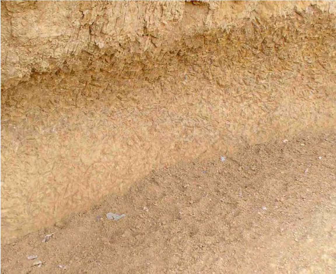
Figura 5. “Marcas de bicada desenharam o barro onde os papagaios mais comem. O chão abaixo, onde pousam os papagaios para comer, mostra uma outra estrutura. Apesar do grande número de aves que visitam o local, não se encontram fezes, indicando que toda a área em volta é universalmente reconhecida pelos animais como lugar específico para alimentação.” Retirado do Relatório final de 18 de maio de 2005, Diagnóstico Temático de “AVIFAUNA” UHEs Salto do Jirau e Santo Antônio elaborado pela Curadoria de Aves, Coleções Zoológicas Instituto Nacional de Pesquisas da Amazônia – INPA .