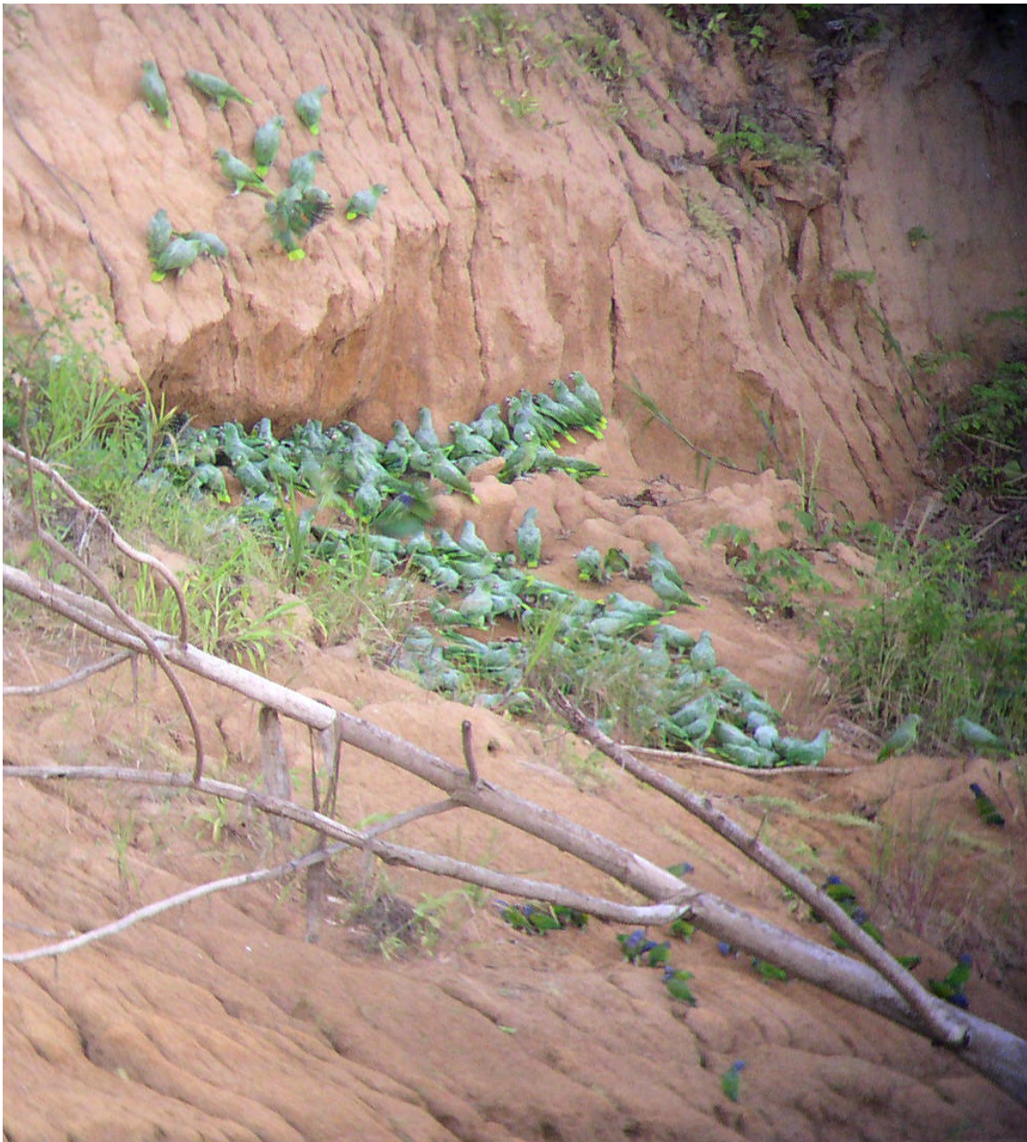
Figura 4 . “Os aproximadamente 130 papagaios presentes nesta imagem estão todos comendo barro. “Geofagia”, o termo técnico para ingestão de terra, serve em papagaios uma função de destoxificação dos frutos imaturos que comem. Pela importância desses solos na vida dos psitacídeos, os barreiros atraem milhares de indivíduos de um raio indefinido, mas provavelmente envolvendo centenas de quilômetros. O lugar predileto (centro) está dominado pelas espécies maiores, Amazona farinosa e Amazona ochrocephala , enquanto outras espécies menores se espalham em volta (canto direito inferior).” Retirado do Relatório final de 18 de maio de 2005, Diagnóstico Temático de “AVIFAUNA” UHEs Salto do Jirau e Santo Antônio elaborado pela Curadoria de Aves, Coleções Zoológicas Instituto Nacional de Pesquisas da Amazônia – INPA .