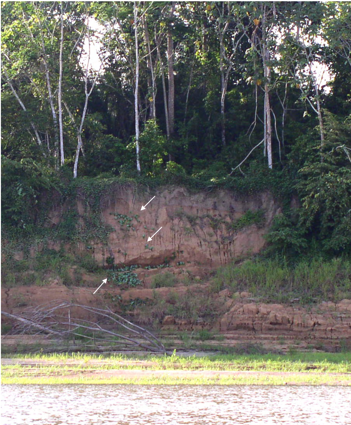
Figura 3. “O barreiro de papagaios à jusante de Abunã, na margem direita do Rio Madeira. Dezenas de papagaios de varias espécies estão espalhadas no barro exposto do barranco (concentrações marcadas com setas). Este barranco todo e o platô acima ficam submersos durante a época da cheia anual, e seria permanentemente inundado pelo proposto empreendimento.” Retirado do Relatório final de 18 de maio de 2005, Diagnóstico Temático de “AVIFAUNA” UHEs Salto do Jirau e Santo Antônio elaborado pela Curadoria de Aves, Coleções Zoológicas Instituto Nacional de Pesquisas da Amazônia – INPA.