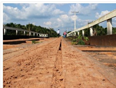
Ponte sobre o Igarapé Jordãona BR-319

Obras em trecho foram suspensas pela Justiça Federal após embargo. Estrada é defendida por políticos; ambientalistas alertam para impactos.